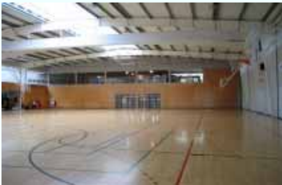
El polideportivo Manteo de San Sebastián, situado a 200 m del colegio San Ignacio.

A la mañana, practicarán el deporte que hayan elegido, o sea el balonmano femenino en San Sebastián o el rugby masculino en Bayonne, y a la tarde, ambos grupos se juntarán para hacer juntos actividades turísticas y culturales en el territorio transfronterizo.