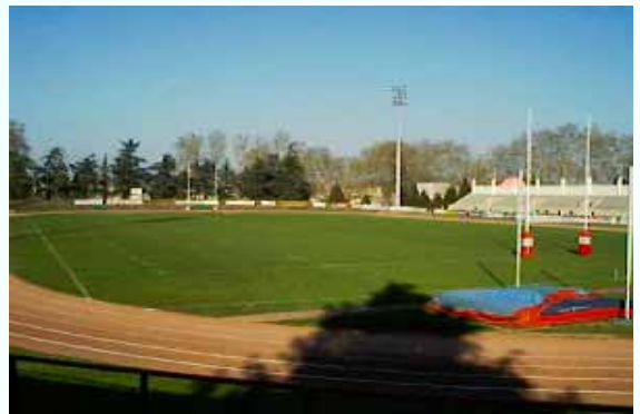
El campo de rugby de Bayonne, a 500 m de la Maison Diocésaine.